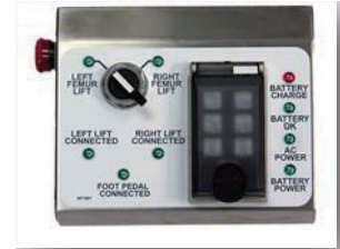
本体コントロールパネル