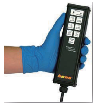
電動ハンドペンダント