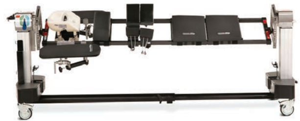
アドバンスドコントロール・パッドシステム™を装着した スパイナルテーブルトップ